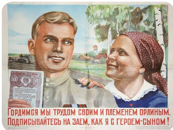
Ватолина Н. Н. Плакат. Гордимся мы трудом своим и племенем орлиным, подписывайтесь на заем, как я с героем-сыном! 1947. Саратовский областной музей краеведения

пропаганде может стать плакат художницы Н. Ватолиной 1947 г. Тем не менее, среди демобилизованных солдат случаи отказа от займа или подписки на меньшую сумму не были редкими 15 .